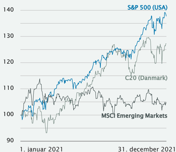
Indeks målt i kroner