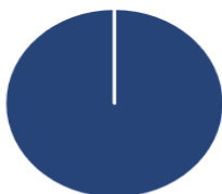
2. Investeringer i overensstemmelse med EU-klassificeringssystemet inkl. statsobligationer*